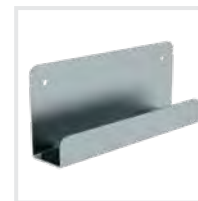
Leiterwandhalter L Bestell-Nr. 19839