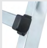
Hochfeste Sprossen-/ Holmverbindung